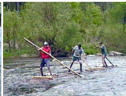
Takhle to vypadá, když to funguje