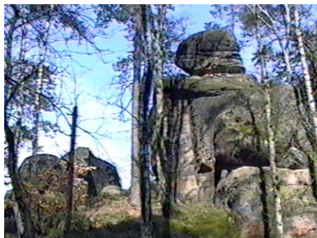
Typické tvary pískovcových skal