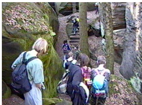
Vstup do skal

Průzkumníci se dostávají až na místo zvané Kalich, kde je památník pobělohorského odboje. Zde se prý skrývali čeští bratři před katolickým