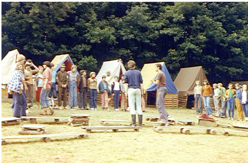
Nástup do akce (Hryzely 1978)

Vám už je určitě od začátku jasné, že onen hlas byl nahrán na mag-