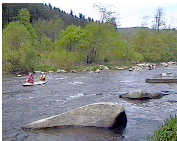
Takhle to vypadá docela jednoduše, i když kameny vzbuzují respekt