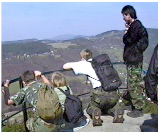
Úchvatný výhled, v pozadí Ještěd