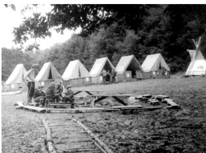
Tábor 1980 byl proslulý především samým bahnem