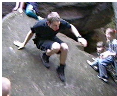
Ještěř sjíždí z balvanu

To už přichází Blondák a ani on se nechce nechat zahanbit. Jenže kamarád Ještěř ho chytá za nohy, takže Blondák bezvládně visí přes závoru.