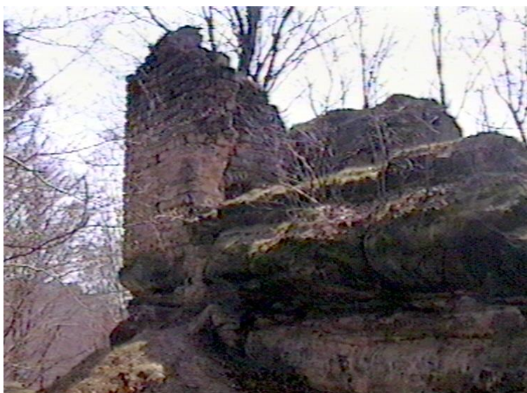
Zřícenina hradu Zbirohy