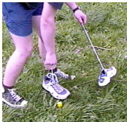
Blondřák hraje s botami loutkové divadlo

„Tak co Tomáši, jak se máš? - Dobře, ale trochu mě bolejí nohy, ani je necejtím,“ mluví při tom.