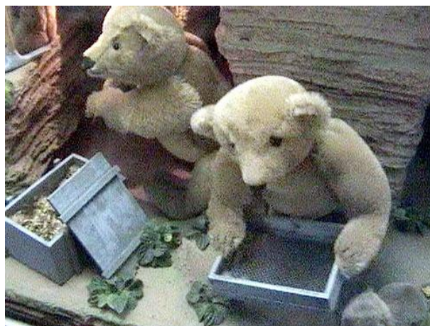
Pohybliví medvídci v Muzeu hraček

Blíží se čas odjezdu, a tak Průzkumníci opouštějí Staroměstské náměstí a jdou na vlak. Na tyto zážitky ale nejspíš nikdo z nich hned tak nezapomene.