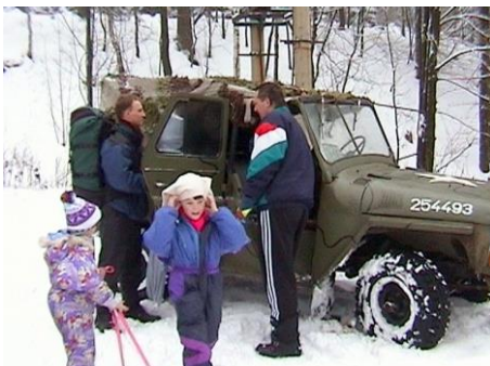
Slon nakládá lyže