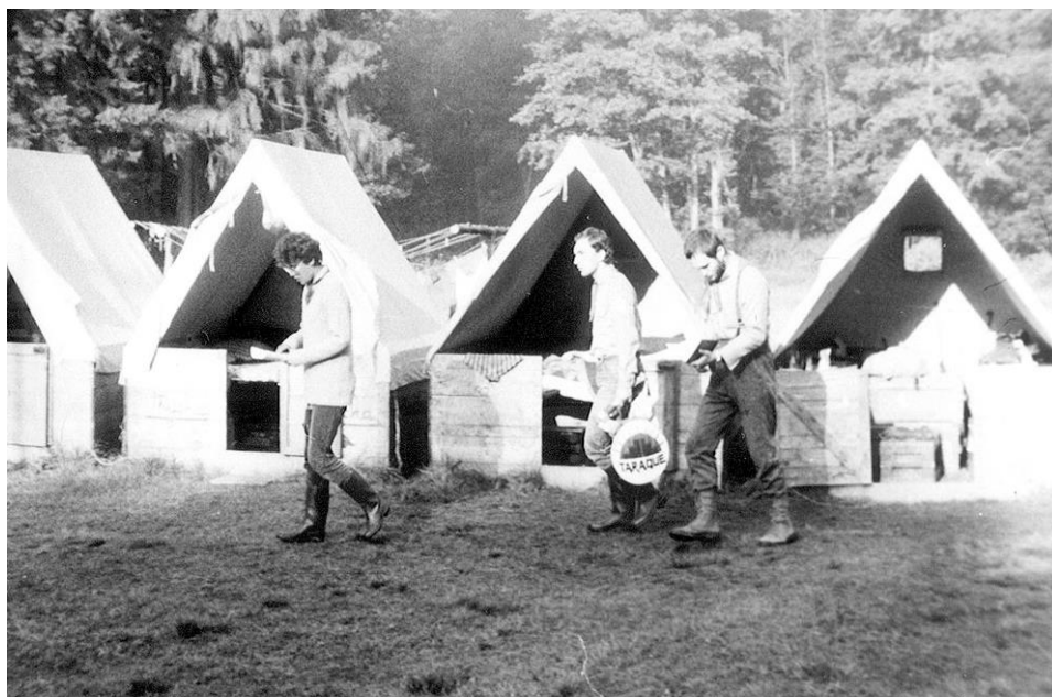
Vlajka hry 1988

Při zkoušce hlasu náčelníka však vyvstal nečekaný problém. Díky hluku splavu na potoce nebyly tamtamy z magnetofonu pořádně slyšet. Nakonec tedy Šed'ovi, který obsluhoval magnetofon, nezbylo nic jiného, než si s sebou vzít odpadkový soudek (některého bratříčka známého Bonifáce) a mlátit do něj. To už stačilo. Naštěstí s tím vším