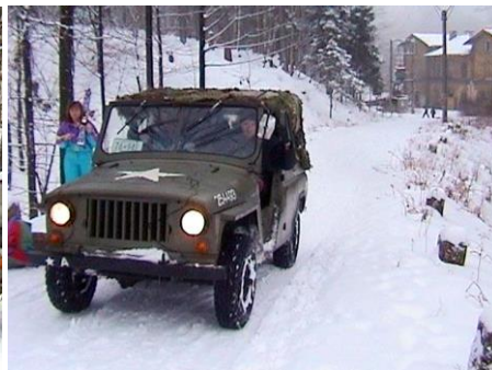
Džíp v akci