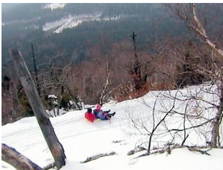
Sjezd z Jedlové na pekáči

V noci na pondělí zase sněžilo a ráno se lyžaři vydávají na sjezdovku.