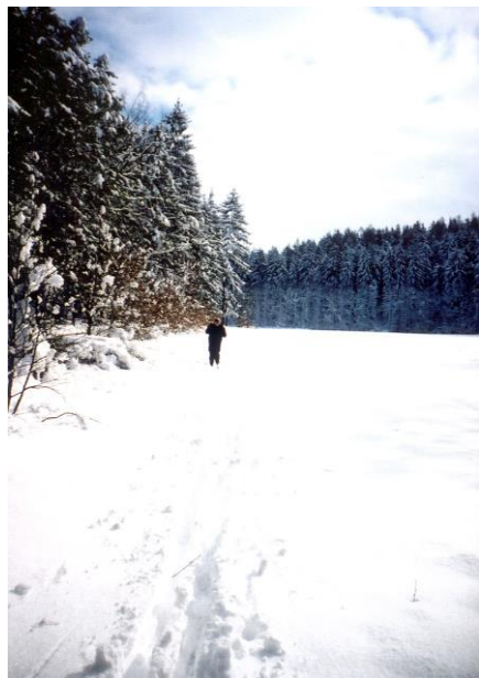
Je to opravdu u Nouzova?

Večer následoval další test. Sauna byla roztopena na 120^{\circ}\text{C} . Při okolní teplotě -14^{\circ}\text{C} se zřejmě jedná o rekordní teplotní rozdíl, plných 134^{\circ}\text{C} . Navíc se zdá, že sauna je dobře izolovaná, protože i při této vysoké teplotě uvnitř neroztál sníh na střeše sauny.