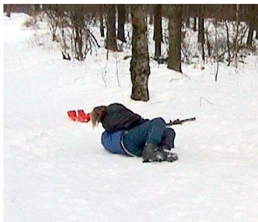
Aleš se vrhá na Sysla, ale Sysel má jasně navrch

Nouzovský Žurnál, ročník XV, číslo 1 vyšlo 23. března 2001 v Kolíně - uzávěrka 18. března 2001