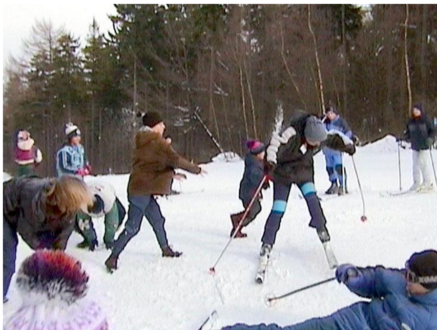
Bitka nelyžařů s lyžaři

protože vzápětí se ocitl vespod a už tam zůstal. Pak zkoušel ještě bojovat s Jaruškou, ale ta měla při sobě své bodyguardy, jako například Krtka, kteří Alešovi všemožně znepřijemňovali život. Nakonec lyžaři odjeli a pěší pokračovali na Křížovou horu.