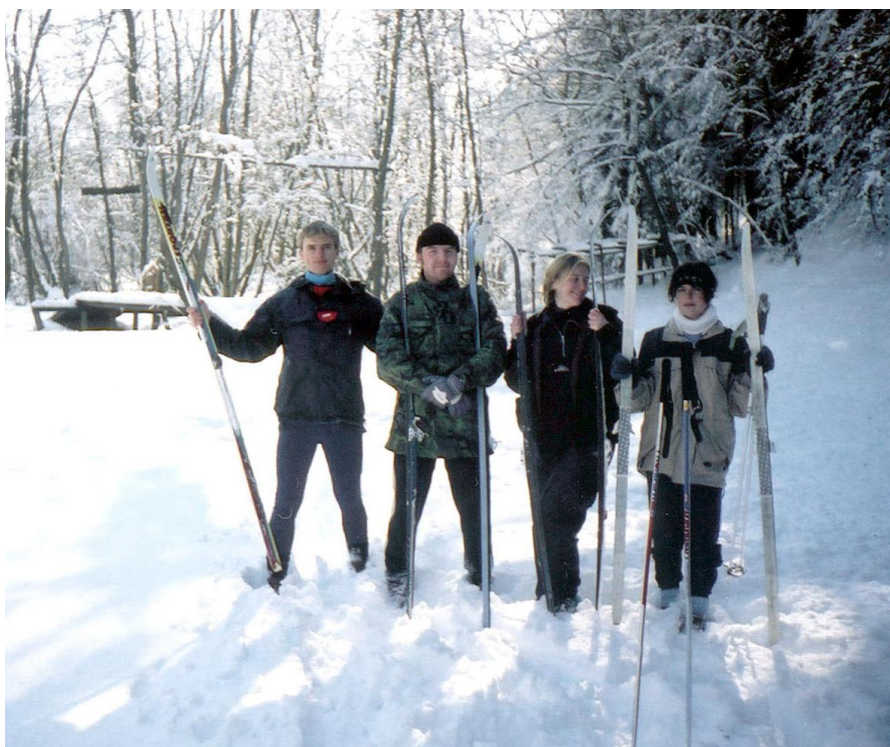
Vyznavači bílé stopy na tábořišti Oregonu

Třetím testem byla výstavba iglú o výšce 130 cm a průměru podstavy 200 cm zhruba pro 2 až 3 osoby. Přesvědčení nebylo ověřeno.