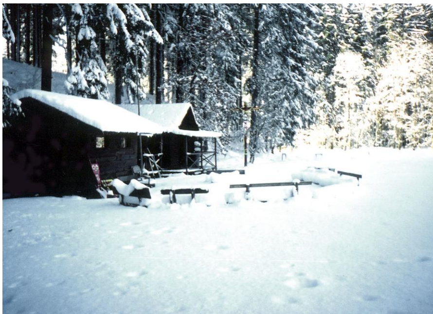
Zima jak z pohádky