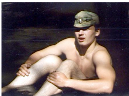
Starosta testuje, jestli jsou v potoce pirani