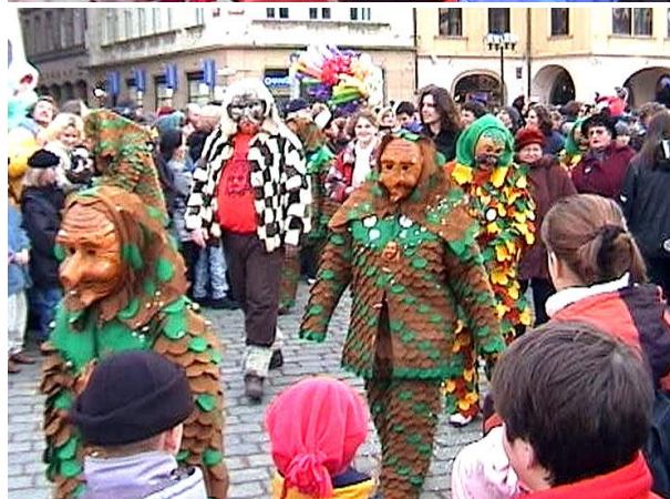
Některé masky rozdávaly bonbony, některé hrály, některé sypaly jenom papírky