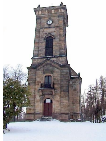
Kostel na Křížové hoře