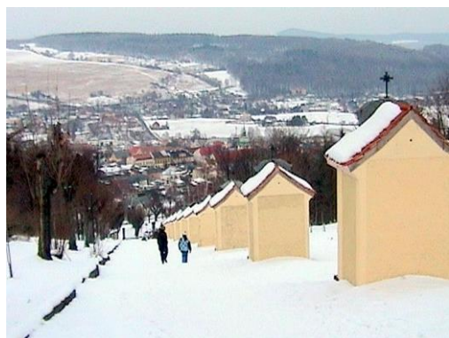
Křížová cesta nad Jiřetínem