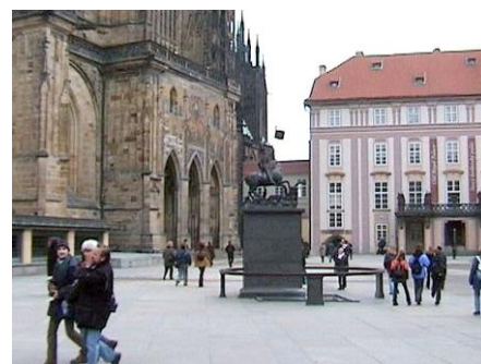
Na Pražském hradě