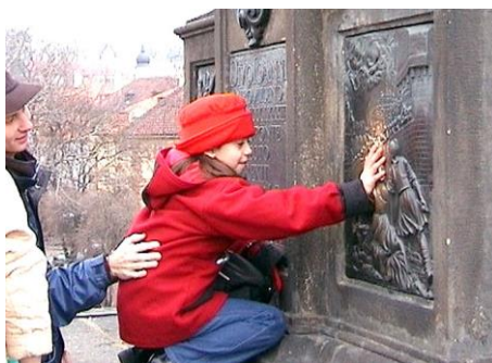
Nikča si sahá pro štěstí