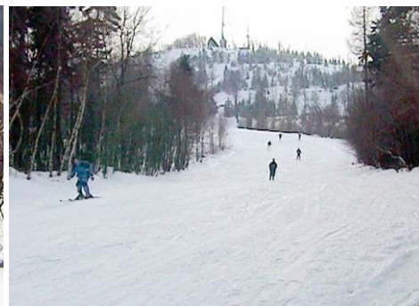
Lyžaři na sjezdovce

V úterý přivítalo lyžaře na sjezdovce sluníčko. Byl krásný den, sníh na stromech se třpytil, prostě zima, jak má být. Krtek se ne a ne zbavit strachu. Hned pod Tolštejnem sjel z široké cesty a trefil se přímo do sloupu s transformátorem. V širém okolí samozřejmě jiný sloup nebyl. Kátě a Krtka chvíli přemlouvala a Šedá pak do něj musel strčit, aby se zase vůbec rozjel. Slon se rozhodl, že