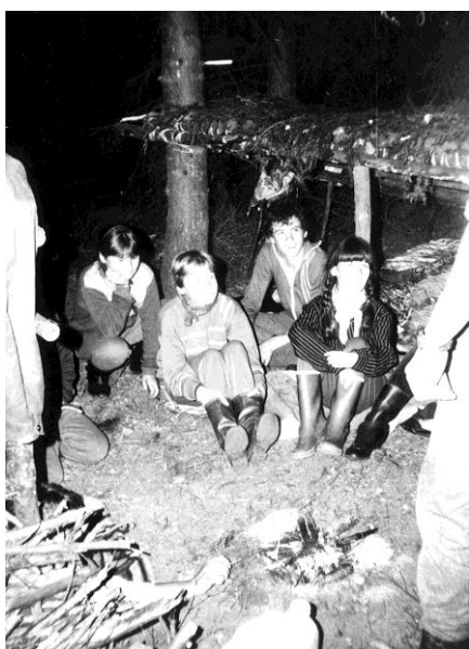
Přístřešek vždy sloužil jako evakuační prostor

Na invazi roku 1981 stavěli vedoucí na stráni nad potokem proti hryzelskému tábořišti kamennou mohyly. Byla to