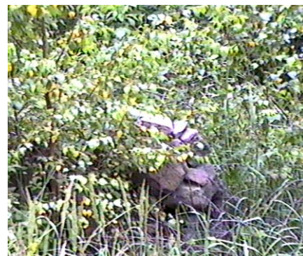
Mohyla 1981 a dnes

znovu šanci. Přírodním místem pro seance s duchem byla samozřejmě skála za potokem, pod kterou Šed'a postavil menší mohyly.