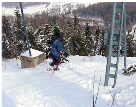
Slon sjíždí pod vlekem

Cesta vede z kopce, a tak přicházejí ke slovu pekáče. Naskládali se na ně malí, velcí i ve dvojicích a už frčí dolů, naráží na sebe, válejí se ve sněhu. Slon celé to hemžení chvíli pozoruje a pak říká: