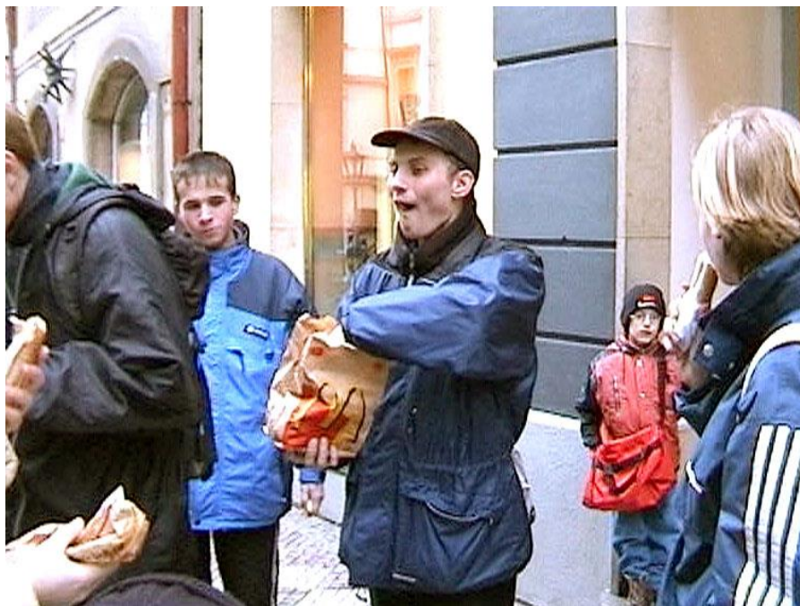
Hranolky od McDonalda a svačinky od maminky