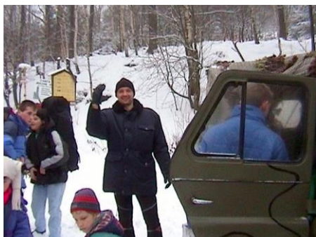
Starosta: „Zdravíme kolínský zájezd!“