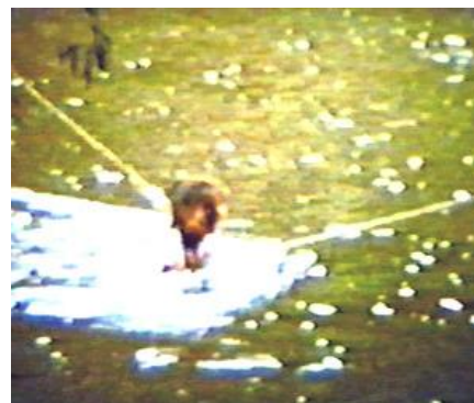
Ještěrka po krk ve vodě