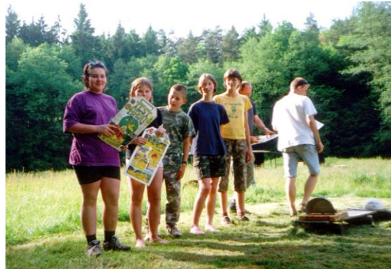
3. místo T.K. Průzkumník