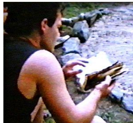
Čert čte z deníku vědecké expedice