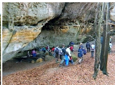
Skalní útvar Krápník