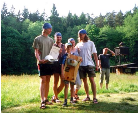
1. místo SPPolek Liberec