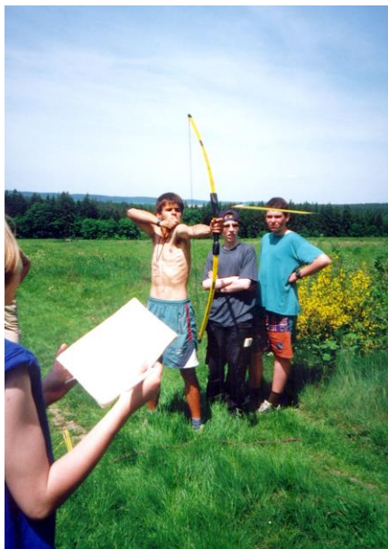
Igrid na lovu

Už počtvrté se 24. května 2001 konala Nouzovská Třístovka. Tato soutěž si udržuje stálou oblibu a počet účastníků rok od roku mírně roste. Loni druzí liberečáci slibovali, že letos si přijedou pro kotlík, a svůj slib splnili. Na znovuzískání trofeje si dělali zuby i Stopaři, ale skončili těsně druzí o pouhé 2 body. Průzkumníci vkládali naděje především do dvou družstev složených z nejstarších Myšek. Dobrydeni, od kterých se očekávalo nejvíce, naprosto propadli v orientaci a skončili hluboko v poli poražených. Turbomyšky odvedly standardní výkon, ale velmi příjemně překvapilo mladší družstvo Vlčat AL. AS. s.r.o., které obstálo v těžké konkurenci a obsadilo skvělé 3. místo, pouhé 3 body za druhými Stopaři. Těšme se tedy na další souboje za rok, pátý ročník Nouzovské Třístovky se koná 25. května 2002.