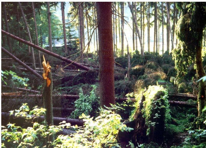
Tornádo vytvořilo v lese nepřilíš široký průsek