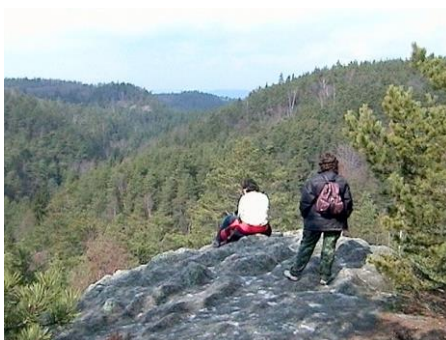
Výhled na skalní město