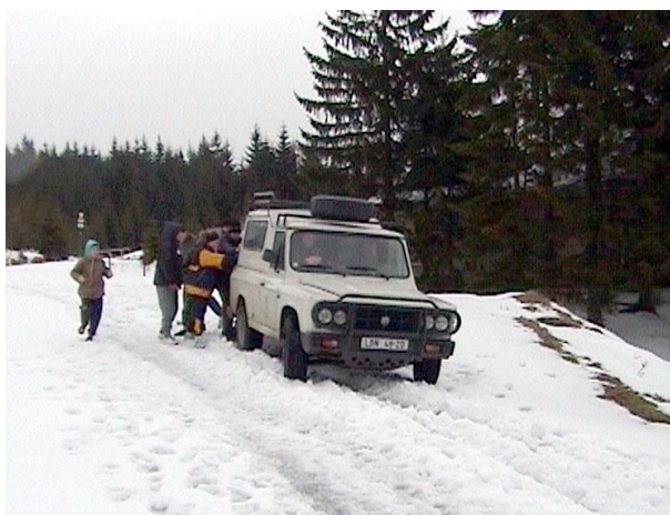
Pokus o roztlačení

okolo nich dokonce projel jeden běžkař. Na Nové Louce si zašli na výborný a levný čaj. Vůbec se zdá, že jsou zde pohostinní lidé. Slon mezitím zjišťuje v Bedřichově, jak se dá dostat v neděli do Liberce. V 9 hodin jede autobus z Bedřichova. S touto informací přichází na Novou Louku, a protože očekává problémy, dohodl s místními odvoz zavazadel na nedělní ráno dodávkou do Bedřichova. Jak se ukáže, bylo to prozíravé rozhodnutí.