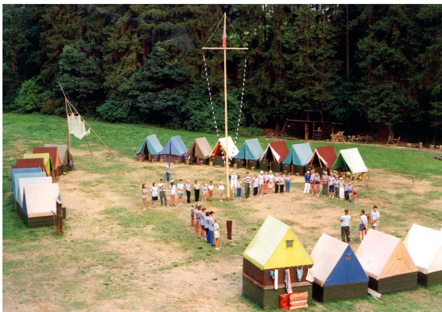
Tábor ve tvaru lodě

Celotáborová hra byla inspirovaná vlastní cestou přes oceán. Tábor byl po-