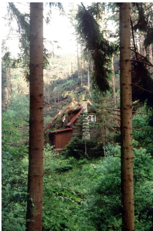
Chata poničená padajícími stromy, v pozadí je vidět oholená stráň

my, pět poničených chat a ve vesnici asi 15 zničených střech.