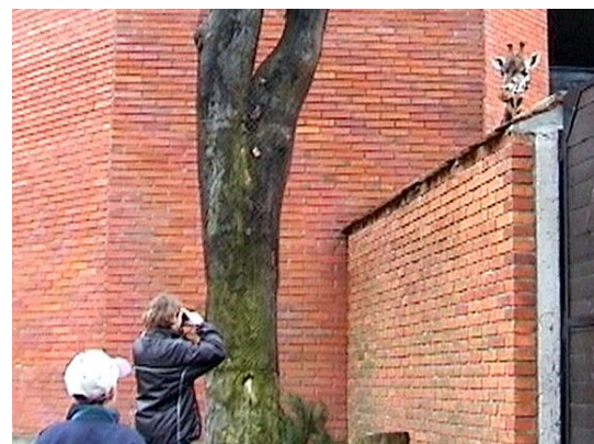
Píďa fotografuje žirafu