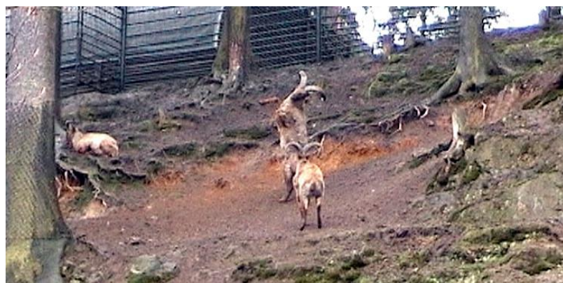
Velmi divoké kozy