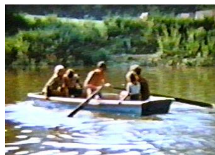
4. družina si zajistila přívaz