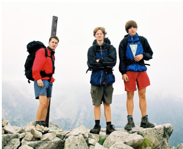
Vrchol Velké Svišťovky (2037 m n. m.) pokořen!