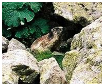
Zvětšenina výřezu fotografie - tatranský svišť

11:45 - Výstup na Rysy. Vyšli jsme z nádraží Štrbské Pleso. Držíme celkem vražedné tempo. Na Popradské pleso přicházíme asi po hodině chůze a už je nám jasné, že až na Rysy to nestihnáme. Pokračujeme a po nekonečných serpentínách se nám do cesty staví oblíbené řetězy na skále. Vydáváme se dále po kamenných schodech a během 20 minut se před námi rýsuje silueta krabice (totiž chaty) zasazené mezi kameny. Ani se nám nechce věřit, protože od neustálého deště jsme rádně prokřehlí. Dvě rundy čaje za příjemných 20 Sk nám náladu přiměřeně zvedají. Jíme sýr a paštiky.