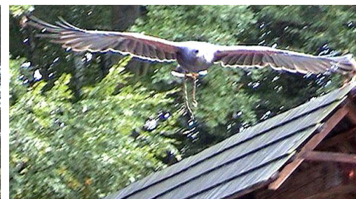
Poštolka a káně v letu