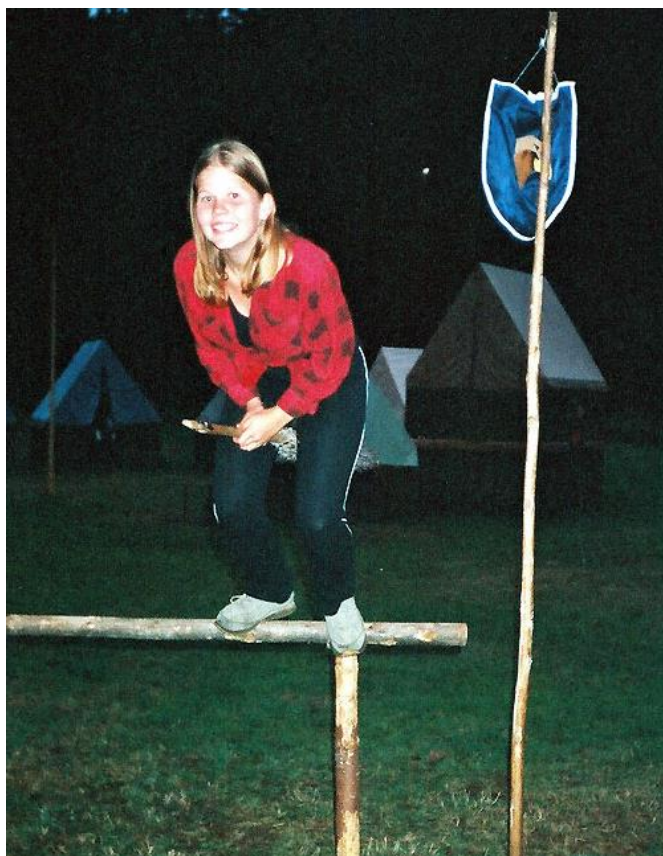
Typická čarodějnice i s koštětem, a takových tu byla spousta