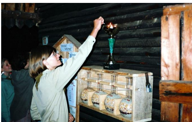
Běťka se hlásí do klání o ohnivý pohár