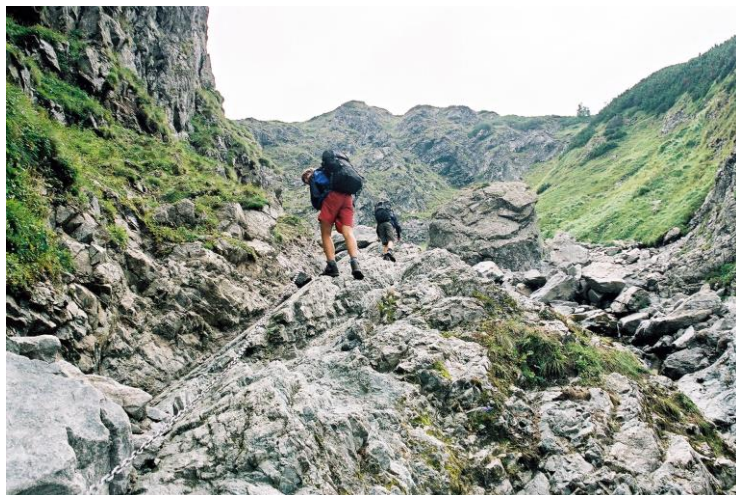
Cesta na Velkou Svišťovku byla velice náročná