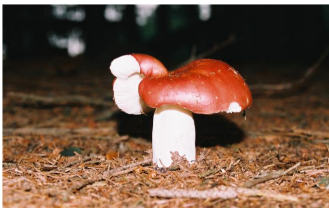
1. místo ve fotografické soutěži v kategorii Příroda - Píďa