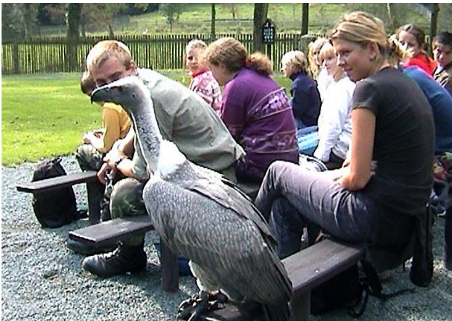
Těší mě, sup