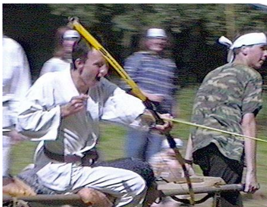
Božská střelba z běžících nosítek

„Mně stačí, když si je nebudu mejt,“ konstatuje Sysel.