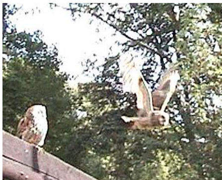
Kalous ušatý v letu

Všichni zúčastnění mají opět na co vzpomínat.