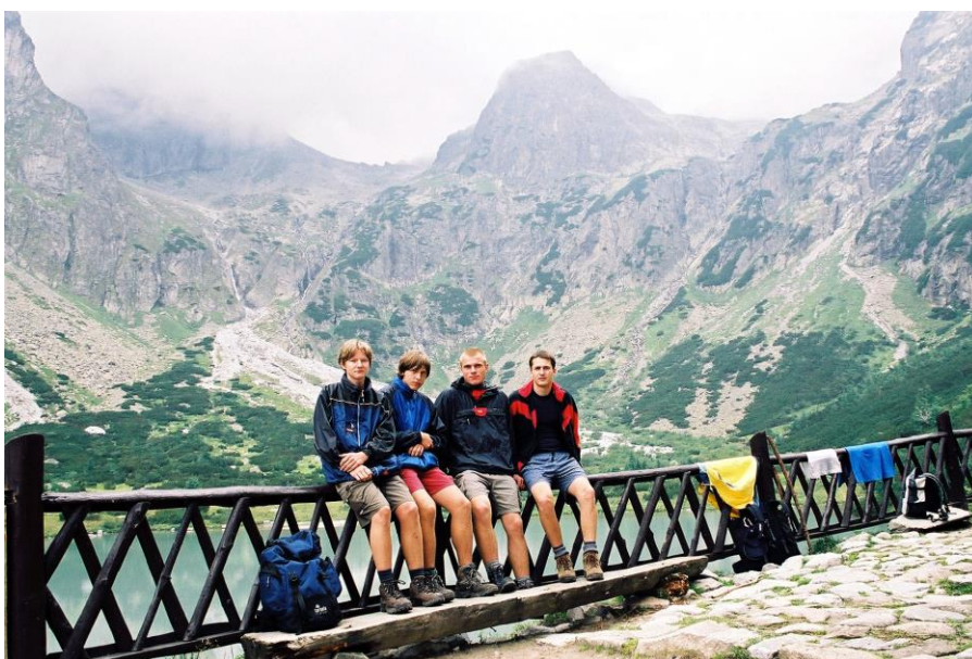
Zelené pleso (1545 m n. m.), v pozadí štíty 2400 - 2600 m n. m.

k úžasnému zjištění. Nacházíme se v rodišti našich bývalých praček Tatrámek. Dnes tu stojí pouze továrna firmy Whirpool.