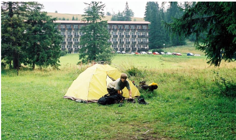
Nocleh u hotelu Magura nedaleko Ždiaru

7:49 - Sedíme v motoráku z Popradu do Tatranské Lomnice. Vlak vyrobený ve Vagónce Studénce pěkně drkotá. Jinak je Poprad pěkně ošklivé město postavené po válce. Samý panelák. Prostě nic moc. Docházíme