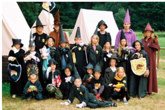
Absolventi kouzelnické školky 28. července až 3. srpna