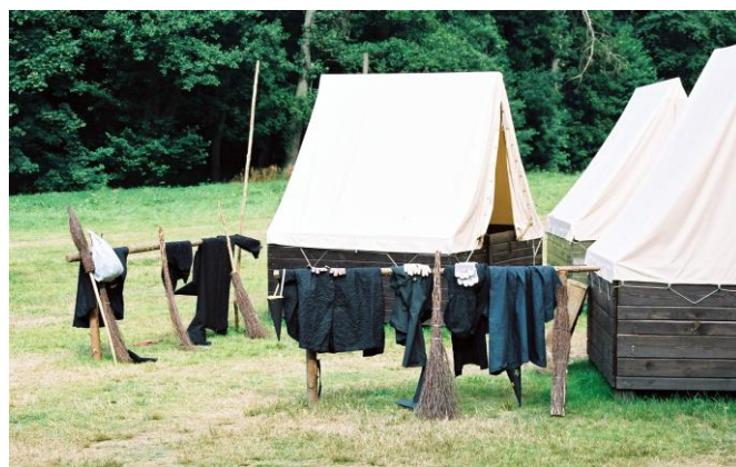
Velký úklid v Bradavicích