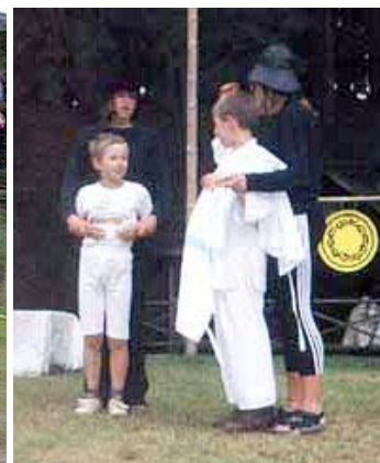
Loutkové divadlo kabuki