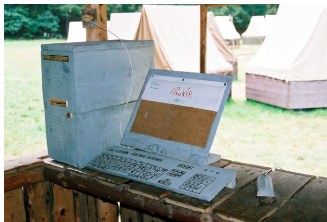
Tohle tu ještě nebylo! Počítač je sice dřevěný ...