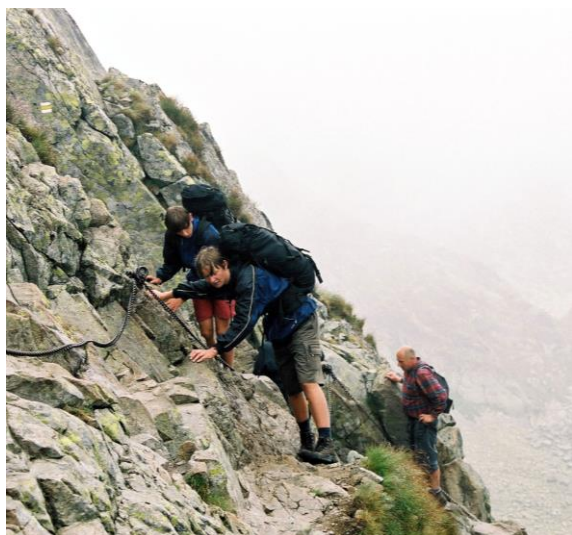
Cesta na Priečné sedlo

Východná (775) - vlak / auto - Kolín (250)