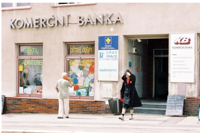
Píďa vybrala Komerční banku v Uhlířských Janovicích