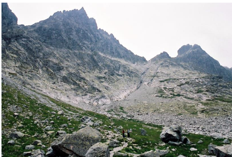
Tatry jsou drsné, ale krásné - pohled z Prielomu na Východnou Vysokou