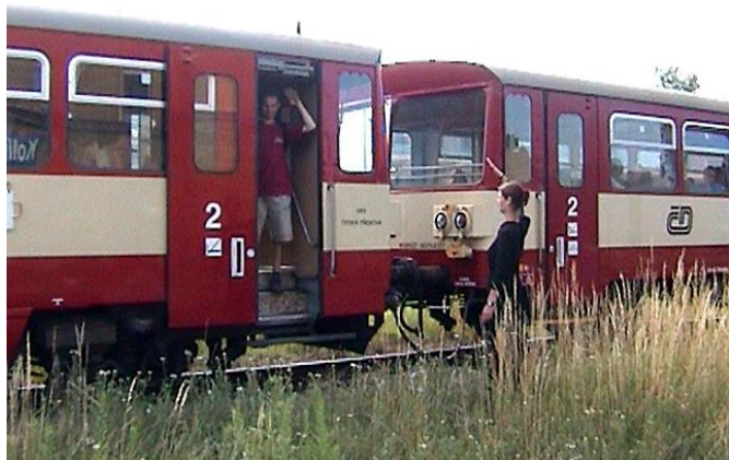
České dráhy se tentokrát nenechaly zahanbit a přistavily zvláštní přímý vůz do Bradavic

6. až 27. července se konal již 32. tábor Průzkumníku. Letošní tábor byl ve znamení Harryho Pottera a kouzelnické školy v Bradavicích.