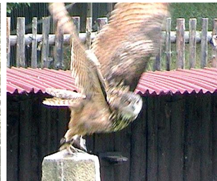
Startující výr velký