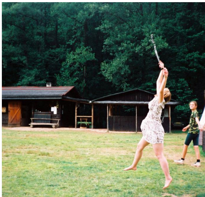
Kam to ten Sysel letí? Nebo žeby pokus o balet?