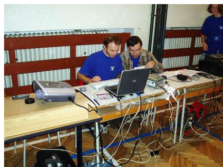
Technika se zmenšuje, ale drátů přibývá