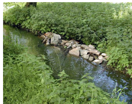
Detail průsaku z náhonu do potoka

Ve střední části je průměrný spád až k Radimi na délku 18,8 km 2,9 ‰, ve zbývajících 1 ‰.