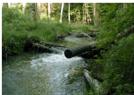
Pokácené porosty v toku

Na 48,28 ř. km (u Stopařů) se pomocí pevného jezu z Výrovky odděluje náhon pro bývalý mlýn v Nouzově. Obě koryta dále pokračují údolím společně rovnoběžně ve vzdálenosti od 5 - 10 m. Upravované koryto náhonu má nižší hydraulický sklon a po několika desítkách metrů je patrné vzájemné převýšení o 1 - 1,5 m. Na několika místech dochází k průsaku vody z náhonu. Dochází zde ke svahové erozi.