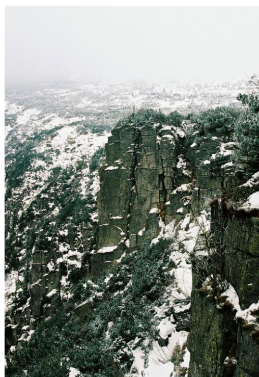
Skály u Pančavského vodopádu