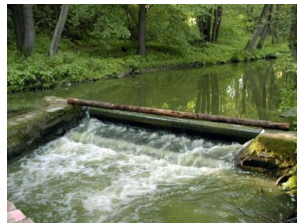
Jez JP15 - začátek náhonu pro nouzovský mlýn

Výrovka má protáhlé povodí o ploše 544,2 km 2 . Délka toku je 63,4 km s absolutním spádem 322 metrů. Horní úsek až k rybníku Vavřínek má délku 10,3 km a spád 11 ‰, v další části po Kouřim na délku 18,2 km je spád 7 ‰.