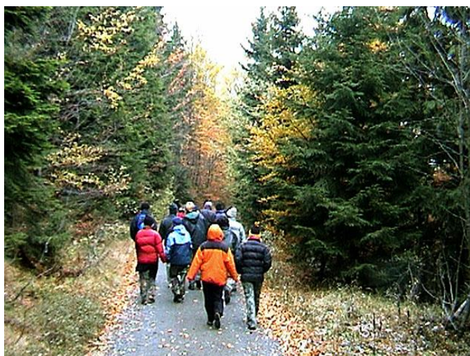
Podzimní cesta nad Rezkem

Někteří by se klidně váleli třeba celý den, ale proto se nejelo na hory. V sobotu dopoledne tedy vyrazili všichni na velkou túru. Počasí bylo klidné a celkem slušné, i když bylo zataženo. Průzkumníci se vydali přes Rezek pod-