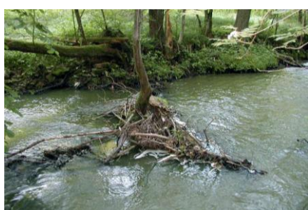
Větvě tvořící ostrůvek