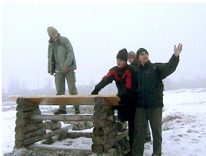
Vyhlička v Kotelském sedle - Buggy věští z mlhy