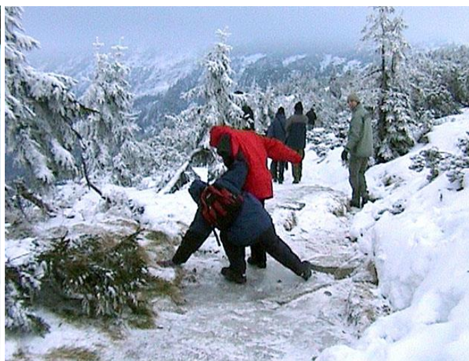
Janinka bruslí na zmrzlé cestě