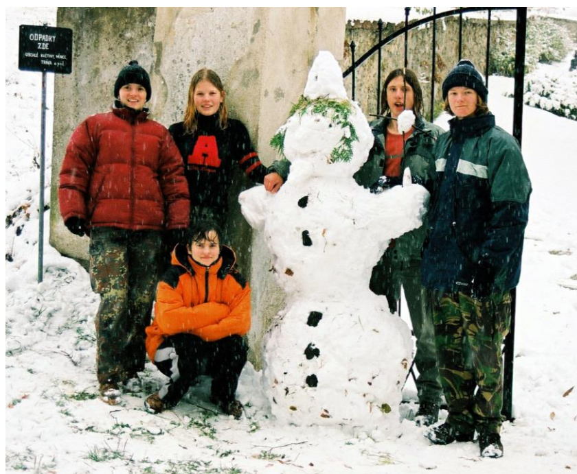
První sněhulák a jeho stavitelé