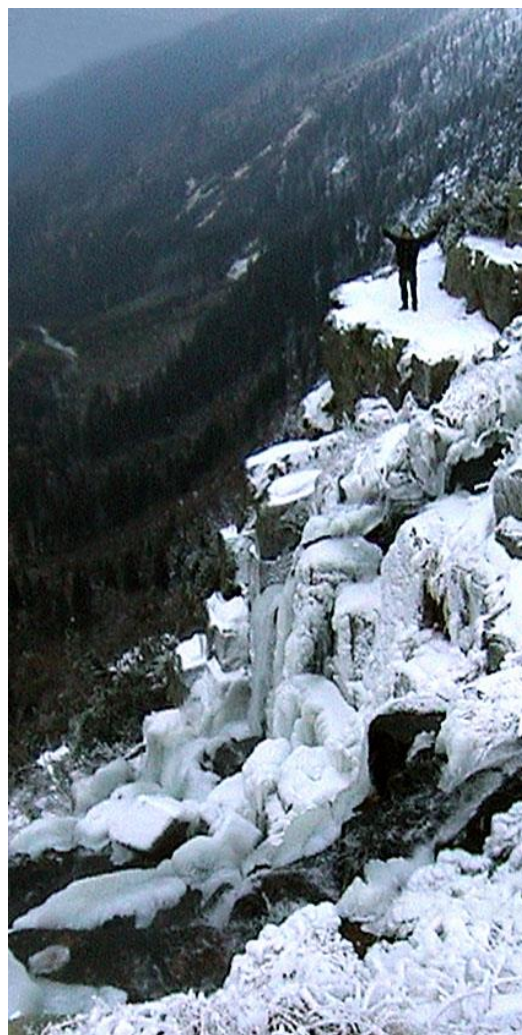
Blondák nad Pančavským vodopádem

V neděli všechny čekalo překvapení v podobě čerstvě napadlého sněhu, z čehož řidiči neměli příliš velkou radost. Vše se ale obešlo bez větších potíží a před odjezdem ještě vyrostl u kostela první sněhulák zimní sezóny 2003 / 2004.