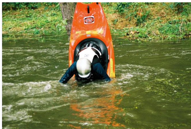
I takováhle kouzla předvádějí vodáci na Vavřinci