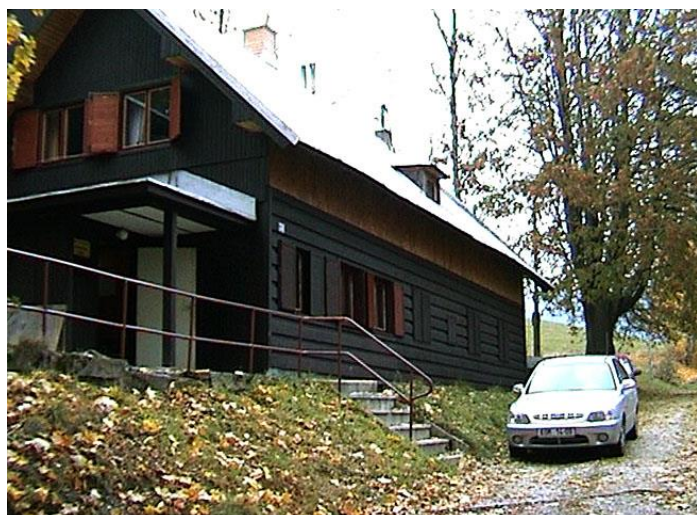
Chata ve Vítkovicích

Na víkend 24. až 26. října 2003 zajistil Tom chatu ve Vítkovicích v Krkonoších. I vedoucí si občas potřebují od dětí odpočinout, ale přitom chtějí být spolu. A právě takováto akce jim k tomu dává příležitost. Navíc se těchto akcí často zúčastňují i bývalí vedoucí, kteří už na běžnou činnost v oddíle nemají čas, ale rádi stráví víkend se svými kamarády.