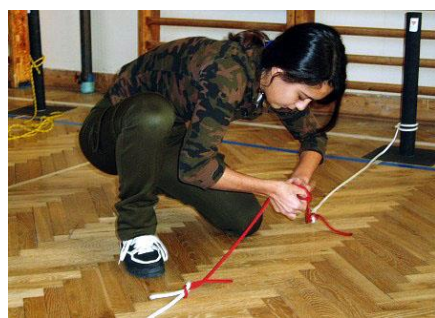
Monča se vešla pod 30 s