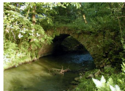
Kamenný mostek v pohledu proti proudu

Na 46. ř. km jsou v okolí budského mostku časté šterkové pohyblivé lavice, které mimo jiné snižují jeho průtočnou světlost. Mostek (M41) je prefabrikovaný na železných nosnících profilu I30. Délka mostku je 14,2 m, šířka 2,2 m a výška nade dnem 1,6 m. I při nižších průtocích lavice způsobují erozi břehů.