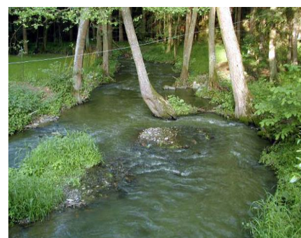
Šterkové pohyblivé lavice na Budech