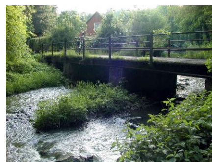
Mostek M41 na Budech