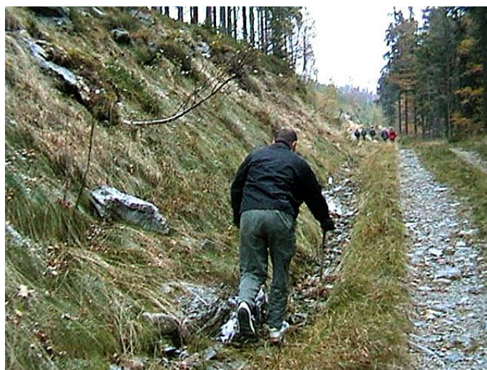
Není nad původnost...