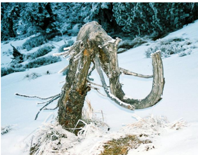
Zmrzlý slon nebo mamut?