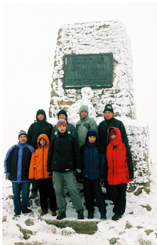
Před Vrbatovou mohylou