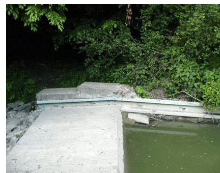
Jez JP14 - detail vymílání