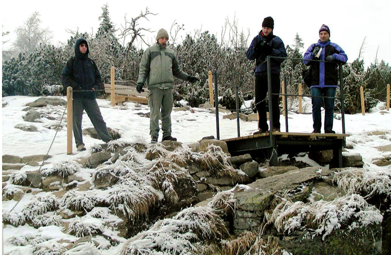
Průzkumníci u vodopádu Pančavy