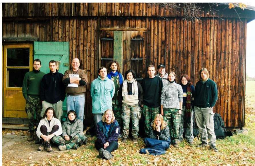
Cílová bouda u Sionu

A jaké jsou další plány? Marian slibuje, že za rok něco uvidíme. Tam jsme prý ještě určitě nikdo nebyl. Že by Morava 2? A následující rok je jubilejní 20. ročník. Máme se tedy určitě na co těšit.