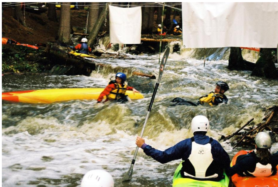
Každý podzim se z Vavřínce stává dravá řeka

Tok je zde neupravený, koryto přirozeně protéká údolím, které je asymetrického tvaru. Jedna ze strání (podle oblouku) vždy příkře spadá ke korytu. Charakter koryta je přirozený, tvořený od 49 km meandry a přecházející do táhlých oblouků, ve kterých se tvoří časté usazeniny. Tok nemá charakteristický typ proudění. Vyskytují se tůně, peřeje a proudná voda. Hlinitopísčité břehy jsou většinou svíslé, někde až podemleté. Vegetace je zastoupena ve-