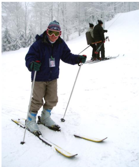
Krtek na lyžích - bez komentáře