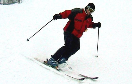
To se to Slonovi jezdí, když to umí