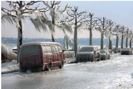
Realita letošní zimy - ledové království v Ženevě