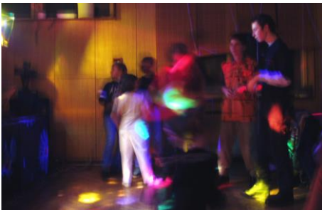
Ve víru diskotéky