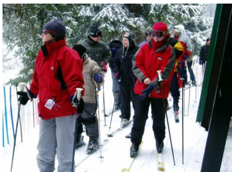
Kačenka a Kačenka