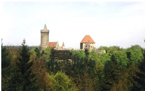
Kokořín - cíl výpravy 9. dubna