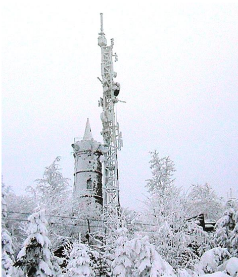
Zasněžený vrchol Jedlové