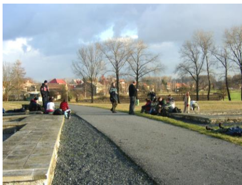
Hradiště Slavníkovců v Libici nad Cidlinou