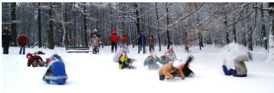
Kotrmelce v prašanu, aneb hromadná výroba sněhuláků

Je třeba poznamenat, že to, co na lyžích předváděla naprostá většina dětí, nemělo s jakýmkoli stylem lyžování nic společného a