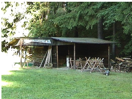
Nový nouzovský nářadovnick (2001)

ny během akce Staří páni. Všichni sice saunování neholdují, ale když jsou během tábora deště, je sauna ve funkci výkonné sušárny k nezaplacení.