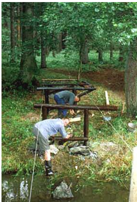
Stavba nového mostku (1999)