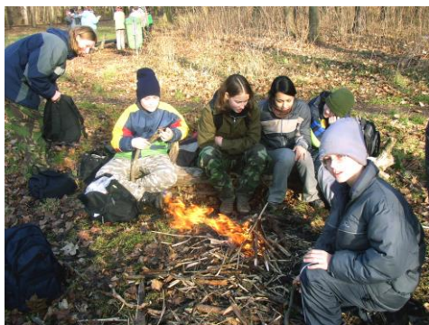
Idylka u ohýnku