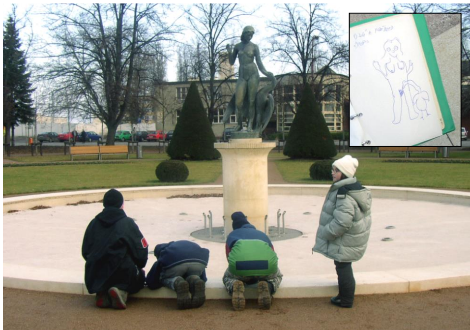
Tak vypadá originál a takto to vidí Ted (ve výřezu)

První výprava roku 2005 se konala 15. ledna. Nato, že byl leden, bylo počasí téměř jarní. Průzkumníci pod vedením Jeníka odjeli vlakem do Poděbrad, kde se v parku u nádraží nejprve věnovali umělecké činnosti. Dostali totiž za úkol najít a nakreslit zdejších šest soch. Výsledky byly opravdu zajímavé. Zatímco někteří načrtli sochy celkem věrně, mnozí se naopak pěkně vyřádili. Našli se i jedinci, kteří se pokusili o založení nových uměleckých směrů. Otázkou zůstává, jestli by si zasloužili přijetí na některou uměleckou školu nebo spíše do psychiatrické léčebny.