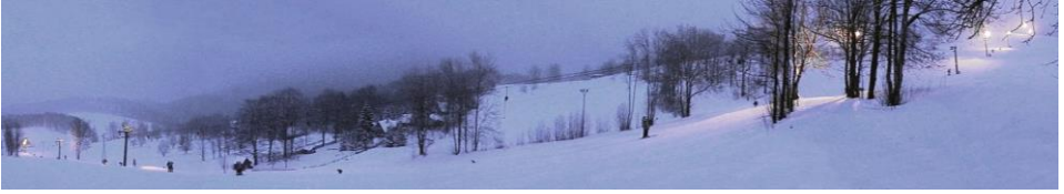
Večerní lyžování na Mezičkách pod Tolštejnem

kvalita sněhu na tom neměla žádný podíl. Učineným fantomem sjezdovky byl Kosmas řítící se z kopce s široce roztaženými rukama i nohama. Konkurence ale byla vysoká. Krtkovi se podařilo za jízdy sejmout Slona, když mu přejel přes špičky lyží. Ještě že na sjezdovce nebylo příliš mnoho lyžařů.