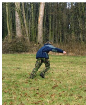
Jeník na gumě