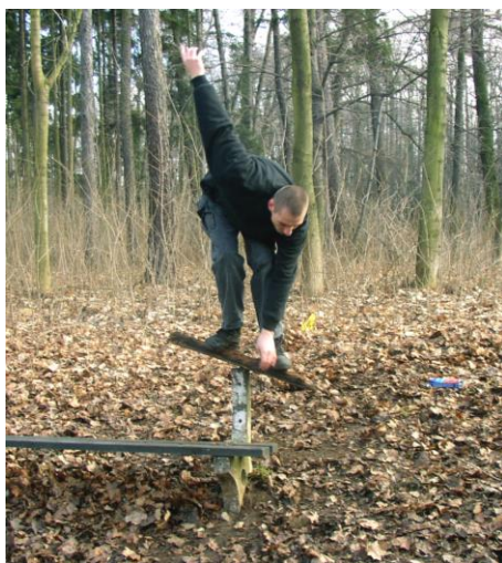
Ještěr surfuje na lavičce

Výpravu ukončili v Libici nad Cidlinou na slavníkovském hradišti. Z Libice pak odjeli vlakem domů.