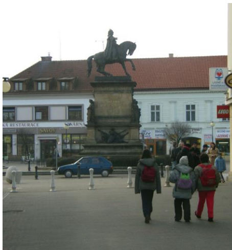
Náměstí v Poděbradech s králem Jiříkem a lázeňskými oplatkami ze sekáče

Přestávku si udělali u jednoho ze slepých ramen, kde si na břehu rozdělali oheň. Pravda, bylo k tomu třeba soustředěného úsilí, ale nakonec se podařilo. Ještě a Aleš objevili nový způsob surfování. Stačí k tomu obyčejné prkén-