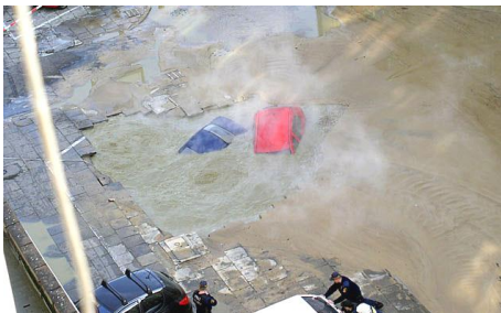
Ani v Praze není bezpečno (postižená ulice se shodou okolností jmenuje Vodičkova)