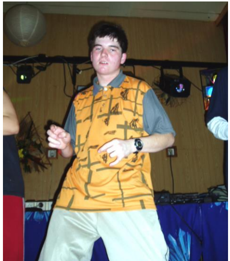
Johny Travolta zamlada