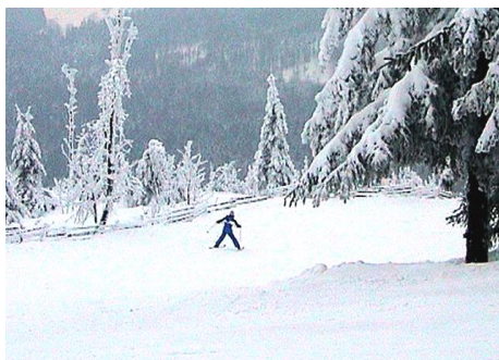
Kosmas - fantom sjezdovky

na oplátku zavedla označení Verbež pro Aleše a ostatní.