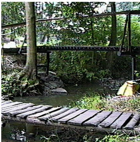
Nový mostek a stará lávka (1999)