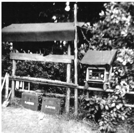
Nářadovnick v Hryzelích, malá budka vpravo obsahuje rozvod pro elektrický hlídač, dole na zemi jsou akumulátory (1973)