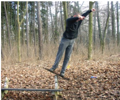
Že by nový sport budoucnosti - surfování na lavičce?