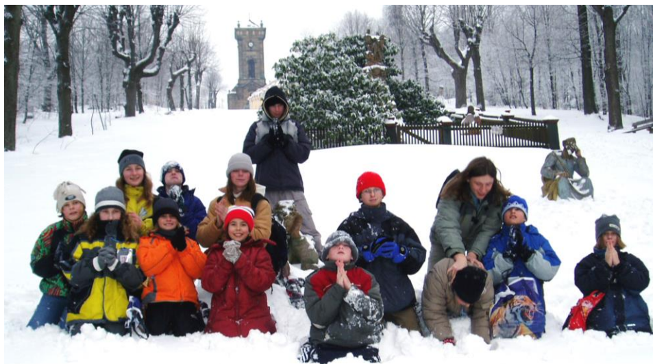
Bezbožníci pod Křížovou horou

Již 7. zimní tábor proběhl 20. až 26. února 2005 opět pod Jedlovou. A jak už bývá u reportáží ze zimního tábora zvykem, probereme si nejdříve meteorologickou situaci této zimy. Už snad ani nemá cenu zdůrazňovat, že tato zima byla výjimečná, protože takové jsou poslední dobou všechny zimy. Každá je něčím zvláštní a každá je jiná. Jestli jednou po letech přijde nějaká normální zima, bude výjimečná tím, že je normální. Tahle zima byla zvláštní tím, že se jí mezi nás příliš nechtělo. Až do poloviny ledna bylo poměrně teplo, sních téměř žádný. Pak ale přišlo výrazné ochlazení a hlavně vydatné sněhové srážky. Na horách napadlo nejvíce sněhu za posledních 40 let. V Krkonoších na Labské boudě naměřili neuvěřitelných téměř 3,5 metru sněhu. Tentokrát tedy vyrazili Průzkumníci na Jedlovou bez obav. Sněhu bylo dost.