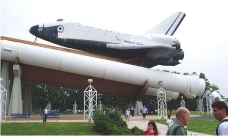
Cvičný raketoplán v Huntsvillu

Pod tímto trochu tajuplným názvem se skrývá jedno velké dobrodružství, které na přelomu června a července prožil Slon. Spolu s dalšími pěti Čechy se zúčastnil akce Space Camp v americkém Huntsvillu, kterou pořádala kosmická agentura NASA. Zde vám přinášíme jeho deník.