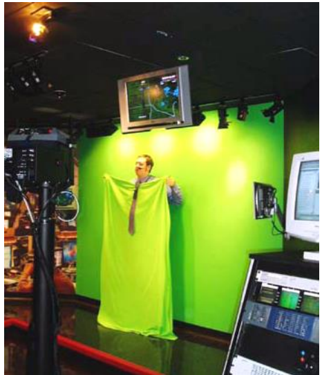
Předpověď počasí CNN v zeleném

Průvodce nás nejdříve bere do jednoho dnes již nepoužívaného studia, kde nás seznamuje s funkcí čtečích zařízení. Jako dobrovolník se mu přihlásil asi desetiletý chlapec, který za-