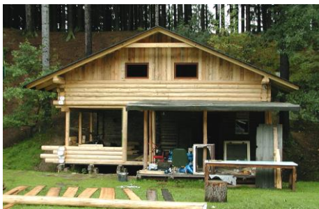
Stav na konci tábora