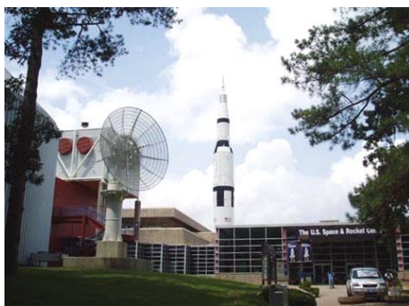
The U. S. Space &amp; Rocket Centrum

z Amsterdamu očekávám cokoliv. Rozhovor je nakonec naprosto standardní. Otázky typu kdo jsem, co jsem, proč cestuji do USA, kolik mám peněz, kdo zaplatil letenky - mi nedělají problém. Úřednice je velmi vstřícná a ani ne za 3 minuty dostávám do pasu to důležité razítko a k němu imigrační kartu. Letadlo do Huntsvillu má malé zpoždění. Na letišti se setkáváme s další skupinou učitelů z Kanady.