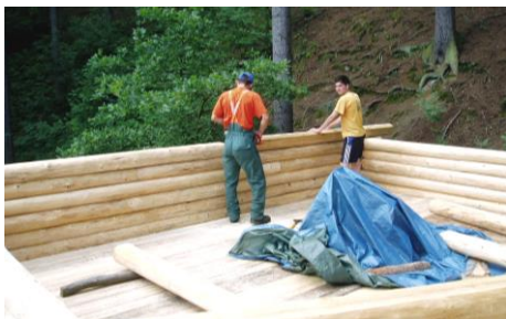
Roubení stěn půdy