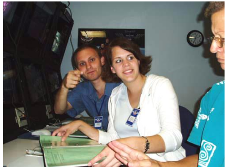
CATO v akci