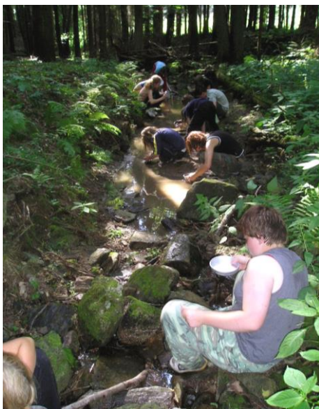
Zlatonosný potok opět po letech ožil