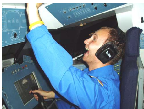
Slon coby pilot raketoplánu