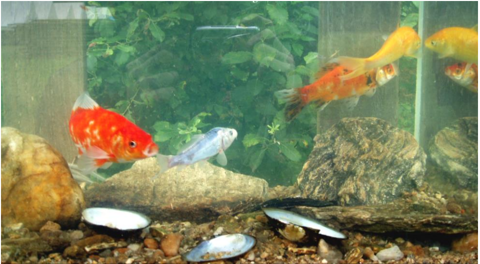
Symbolem letošního tábora byly rybičky

Letošní tábor byl ve znamení lidových zvyků a obyčejů. Táborníci prožili celý kalendářní rok Novým rokem počínaje a Silvestrem konče. Připomněli si nejen ty zvyky, které dobře znali, ale dozvěděli se i mnoha dnes již zapomenutých lidových zvyčích. Lidovým tradicím se vždy více dařilo na vesnici, odtud tedy název Rok na vsi.