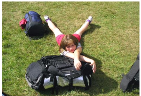
Tomu se říká padnout za vlast