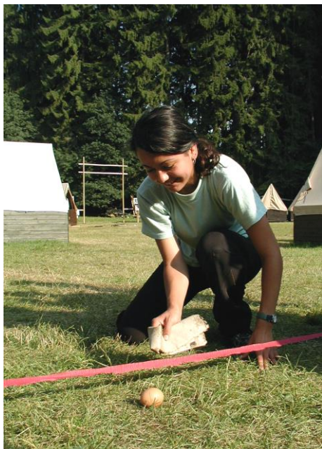
Velikonoční tradice v poněkud kultivovanější formě