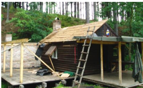
Rekonstrukce srubu zahájena