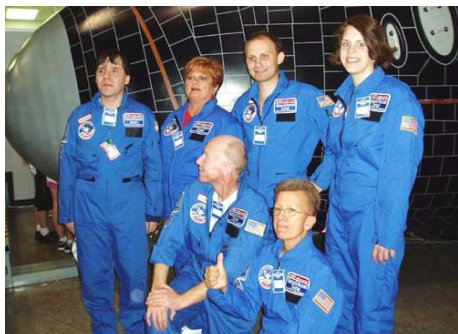
Mise Atlantis připravena do akce