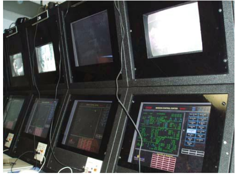
Řídicí středisko mise Atlantis

My ve středisku jsme vyfasovali po dvou knížkách. Jedna s itinerářem uvnitř a druhá s klíčem