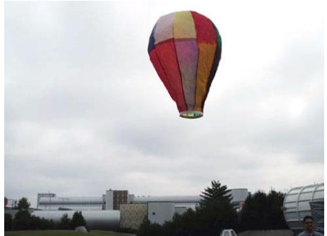
Test horkovzdušného balónu vlastní výroby