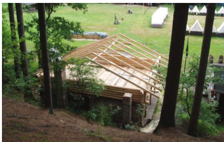
Krovy jsou na svých místech