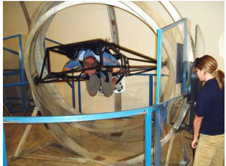
Centrifuga pro simulaci přetížení

Ráno po malém chaosu na recepci odjíždíme z kolejí. Při balení mi přišel kufr příliš malý. Dnes mi ovšem při porovnání s jinými účastníky přijde ještě menší. Hlavním bodem dnešního programu je závěrečný ceremoniál. Dne po snídání jsme ještě vyslechli zajímavou přednášku o geografii, která začala jako všechny předtím