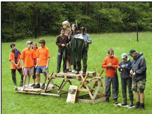
Nejlepší rybízové a tři nejlepší hlídky