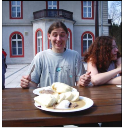
Svičková se šesti, jaký to pohled