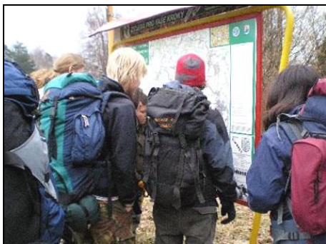
Jak je to ještě daleko?