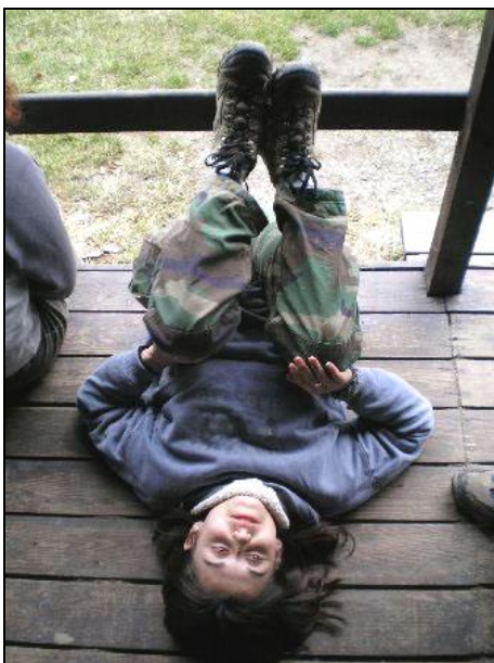
Ach, moje ubohé nožičky