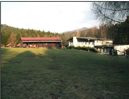
Tábořiště v Jetřichovicích

V kempu nás přivítal milý, avšak nepřilíš výřečný pan majitel, odemkl nám chatky a po chvíli přemlouvání nám dal povlečení a navrhl přihodit basketbalový míč. Akce na sebe nenechala dlouho čekat. Basketbalového utkání na škvárovém hřišti s volejbalovou sítí uprostřed se zúčastnilo 14 hráčů. Zápas to byl napínavý, nicméně jsme soupeře vedeného obávaným řízným obráncem Leninem na plné čáře rozdrtili. Po chvíli přišel Jeník s novým hitem – lezení po tyči hlavou dolů. Zápas s gravitací byl marný, nicméně zábavný. Originální pokusy o zachycení tyče, vymrštění nohou nahoru v nepředstavitelném úhlu a komické neúspěchy nám vydržely asi na půl hodiny. Než nás Sini v šest večer vyhnala dělat oheň, tak jsme stihli ještě soutěž v počtu otáček na tyči bez dotyku země, či skok důvěry. Kolem kempu jsme našli spoustu suchého dřeva, ale oheň bůhvíproč hořet nechtěl,