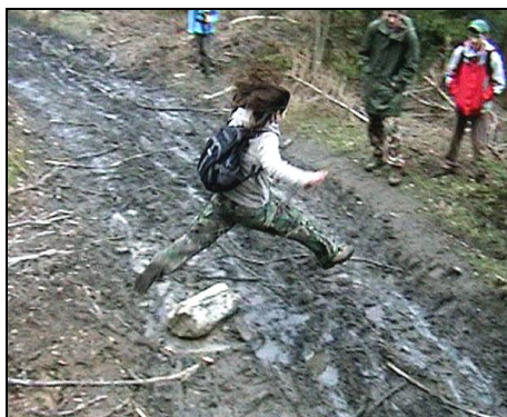
Nikčín skok - přímo do bahna