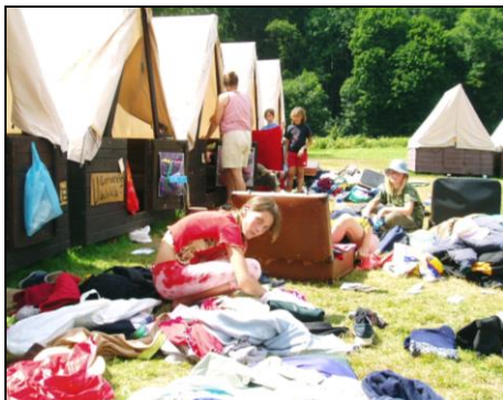
Tohle se přeče do toho kufru nemohlo vejít!