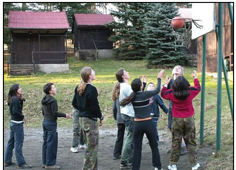
Tak proleze nebo ne?