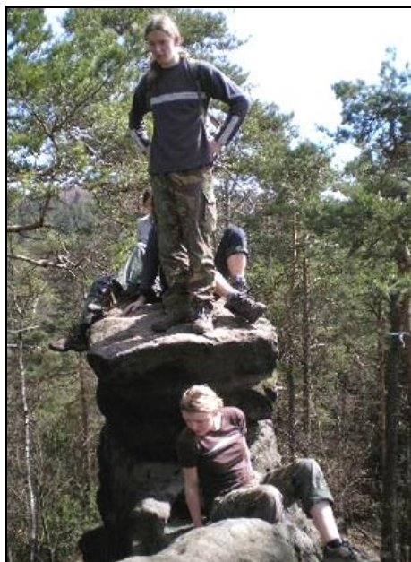
Malá Pravčická brána dobyta