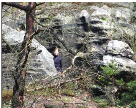
Neviděli jste někde Bětku?

ho, asi tak jeden kilometr. Ovšem i na takto malém úseku nás potkalo překvapení. Z ničeho nic se strhl liják a padaly i kroupy. Zde se naše skupinka rozdělila na chytré, co se schovali pod hustými smrky, a na ten zbytek, který se v hloučku snažil schovat pod opadaným bukem. Na Tokání proběhlo tokání. Někteří, hlavně přívrženci Duduismu (Dudu, Pída a podobná individua), to sabotovali, ale i tak to pro kolemsedící turisty musel být legrační pohled. Rychlé občerstvení a už šlapeme dál. Po pár minutách jsme stáli před skalní stěnou, cesta se zde větvila na normální delší cestu lesem a na akčnější cestu skalami po řetězech a žebřících. Volba byla jasná, bez váhání jsme vyrazili po žebřících vzhůru. Nahoře jsme byli odměněni překrásným výhledem, a tak jsme zde rozbili obědový tábor. S plnými břichy jsme radostně vyrazili dál, měly