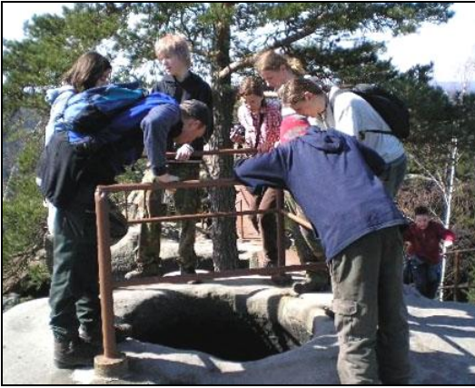
Tak koho tam hodíme?