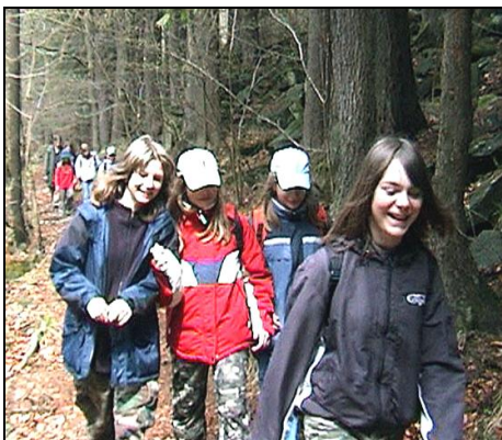
Vždy s úsměvem

V Jesenném jsme si zkrátili čekání na vlak hrou spočívající v kradení ocásků. Zajímavá byla především siamská varianta, kde hrály dvojice hráčů přivázaných k sobě za nohu. Na vlak čeká i dvojice vodáků, které jsme viděli dopoledne v Plavech. Zvládli nástrahy divoké vody bez újmy na zdraví. Pak už přijel rychlík a vydali jsme se domů.