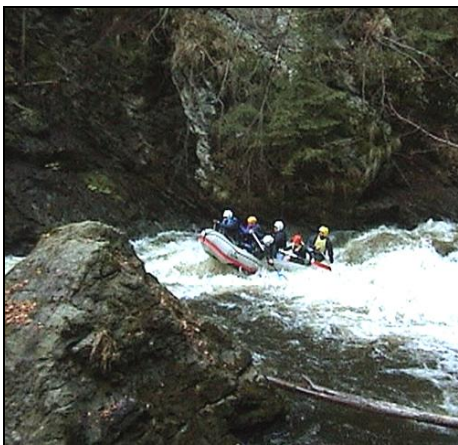
Raftáči na Kamenici