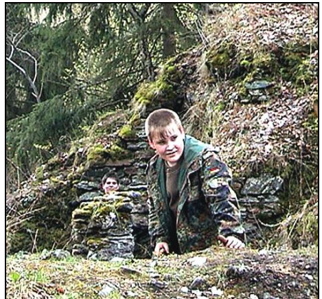
Kachna a Krtek v bitvě o Návarov

Sestoupili jsme ze zříceniny opět do údolí Kamenice. U mostu přes Kamenici v Návarově je mapa údolí. Krtek se snaží zjistit naši polohu, ale jde to ztuhla. Jako tonoucí příslovečného