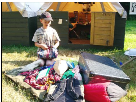
Letecký den je sice nepříjemný, ale na druhou stranu je to nejlepší prostředek, jak se dozvědět, co jsme si s sebou přivezli