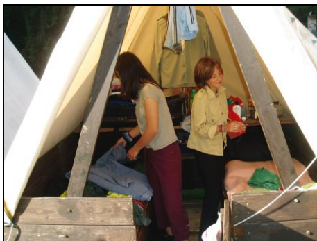
Co je lepší, pořádek nebo chaos?

Konečně je všechno hotovo a nastává výjimečná situace. Všechno je srovnané, rozvěšené, poskládané. A teď pozor! Honem rychle potřebujeme něco, co je právě na dně kufru, potřebujeme to strašně rychle (třeba toaletní papír). Obsah kufru nemilosrdně vyklápíme na postel, veškerý systém se hroutí a bludný kruh se