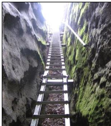
Žebřík do nebe