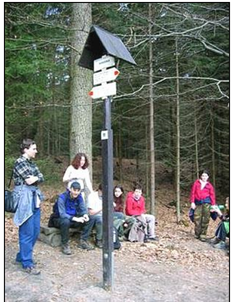
Ještě jsme toho moc neušli a už sedíme

červených kombinézách. Za povzbuzování německých přihlížejících a Kryštůfkova mocného houkání a řevu: „Pendolino jede!“ se peloton dostal až ke skalnímu hradu Šaunštejn. Zde se opět ukázalo, kdo je lenoch a bude svačit pod hradem a kdo má na to dát si svačit nahoře. Na ochozech jsme kromě výhledu a Dudkovy sušenky v mém batohu našli i díru do skály (asi