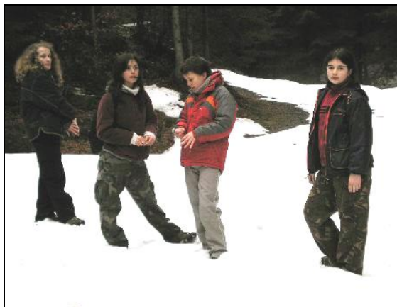
Ve vyšších polohách nebyla o sních nouze