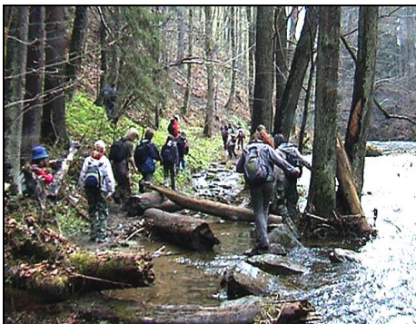
Překonávání zaplavené cesty