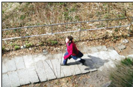
Hů, Pendolino jede!

Byl to parádní výlet, ti kteří se zúčastnili, na něj budou dlouho vzpomínat, a ti co zůstali ležet doma, mohou jen litovat.