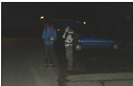
Zápis do deníku v Cerhenicích

20:30 - Monča a Slon jsou na náměstí v Kouřimi velice zklamáni. Mysleli si, že zde najdou mapu, ale není tu. Nevadí, stejně si chtěli jen zkontrolovat, že jdou dobře. Turistické značky nevypadají, že by jim cestu zkrátily, jdou tedy po silnici. Kouřimskou branou procházejí na křižovatku s rozcestníky. Směr Český Brod zavrhnou, Sadská se jim úplně nezdá, jdou tedy třetím směrem. Podle ukazatelů je tímto směrem Klášterní Skalice vzdálená asi 2 km. Vodítkem je opět autobusový jízdní řád, na němž jsou jak Vrbčany, tak i Plaňany. Vpravo