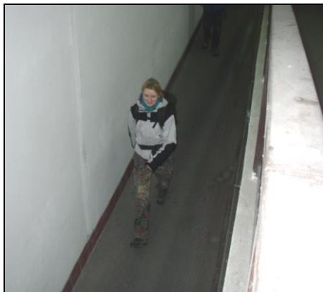
Át'a v podchodu v Cerhenicích

20:53 - Držíme se cyklotrasy, která vede zkratkou a dovedla nás do Radimku. Odtud už je to jen kousek do Plaňan. Átě už docházejí nápady, co se týče mrtvoly, a ptá se už jen jed-