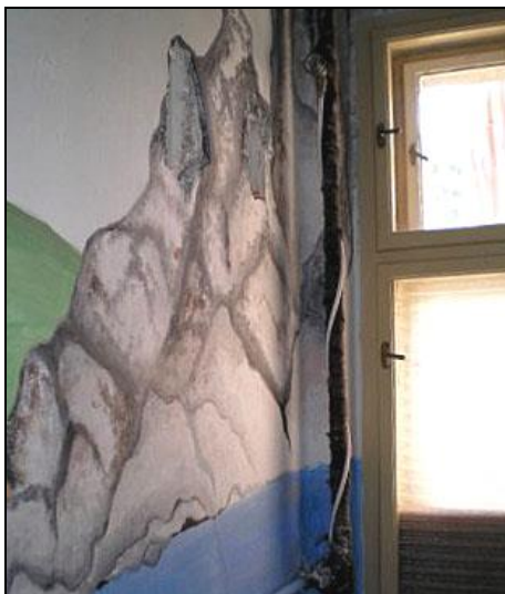
I záchod může být poetické místo