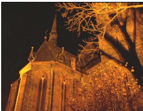
Osvětlený kostel v Plaňanech

22:05 - Vracíme se zpět k nádraží do Plaňan. Nacházíme zde Marianovo auto, takže cíl musí být blízko. Podle mapky mi vychází, že jsme na místě, ale v okolí se nachází jen nádraží se zuřivými psi. Nic jako klubovna se u potoka, který zde protéká, nenachází. Později se ukáže, že na mapce je chybně vybarven potok tak, že překrývá silnici, na které stojíme. Chyba se stane, horší je, že právě tato