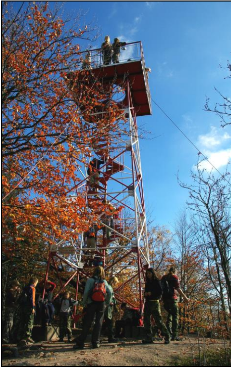
Rozhledna na Žaltmanu