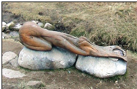
Prapodivná skulptura u pramene Labe