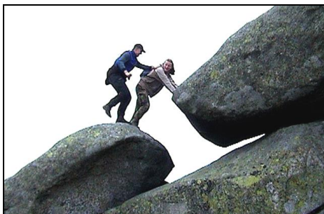
V nouzi přítel poslouží jako most (Slon a Jeník na česko-polské hranici)