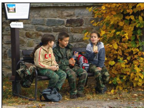
Další generace Průzkumníků