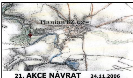
mapa císaře pána

niční trati, která by měla být vodítkem. Maria-nova pomocná mapka na kartičce je pro ně díky slabým baterkám přeci jen trochu matoucí. Vyrážejí podél kolejí k mostu přes Kouřimku. Nejdříve ho přešli s tím, že půjdou směrem dál na Plaňany. Po chvíli se vrací zpět a sledují, zda voda opravdu teče tím směrem, kterým si oni myslí. Vedle mostu je totiž celkem široká cesta jdoucí rovnoběžně podél kolejí jakoby na Plaňany. Riskují to a jdou po ní. Bláto, nebláto, cíl se zdá být blízko.