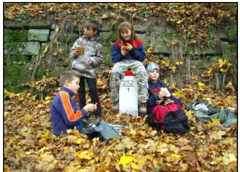
Svačinka na hranicích