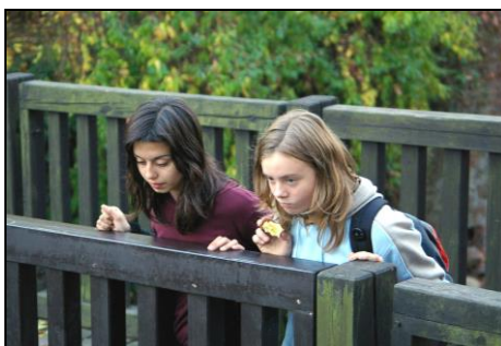
Medvěde, chceš jabko?