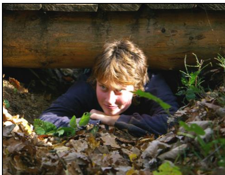
Náročný úkol podplazit lávku přes příkop