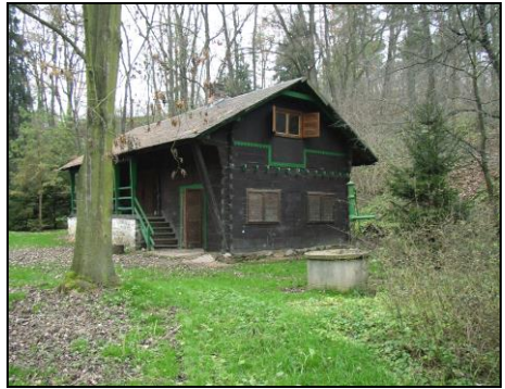
Cíl putování, srub skautů v Plaňanech

23:15 - Po chvíli hledání se Sini a Kůzleti podařilo najít cíl.