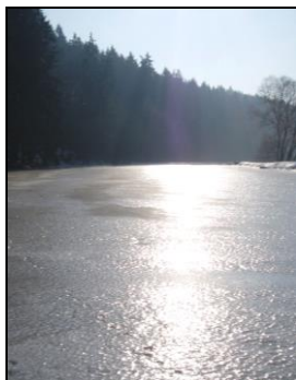
Změna termínů a akcí vyhrazena