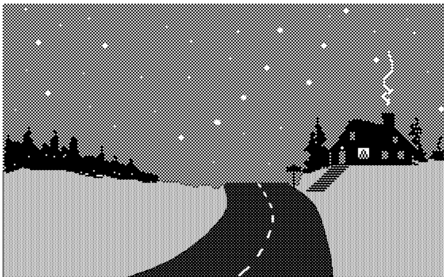
Noční silnice, typická scéna pro akci Návrat